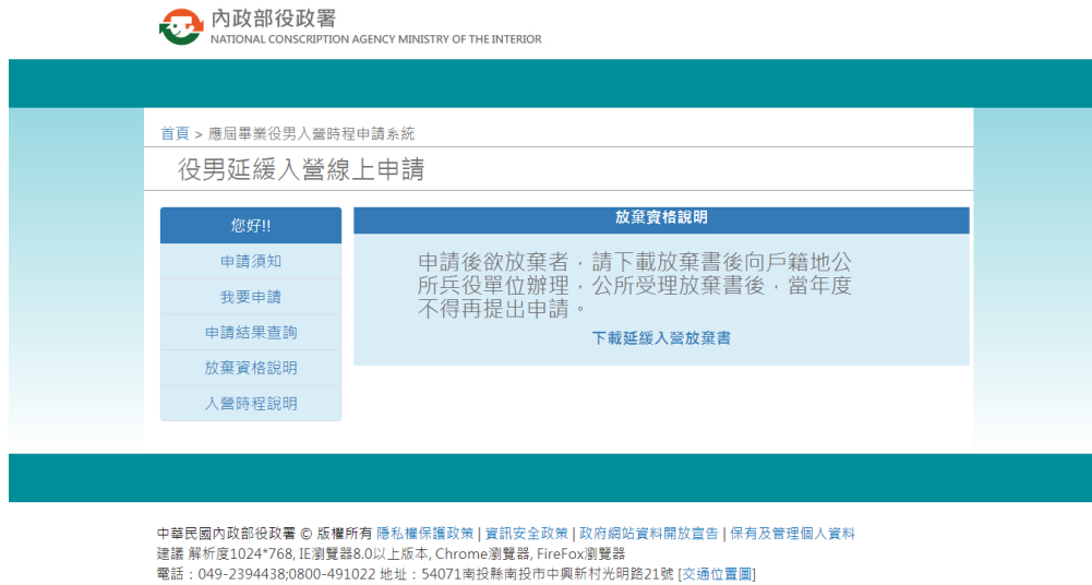
圖 9 役男延緩入營線上申請作業操作說明畫面(9)