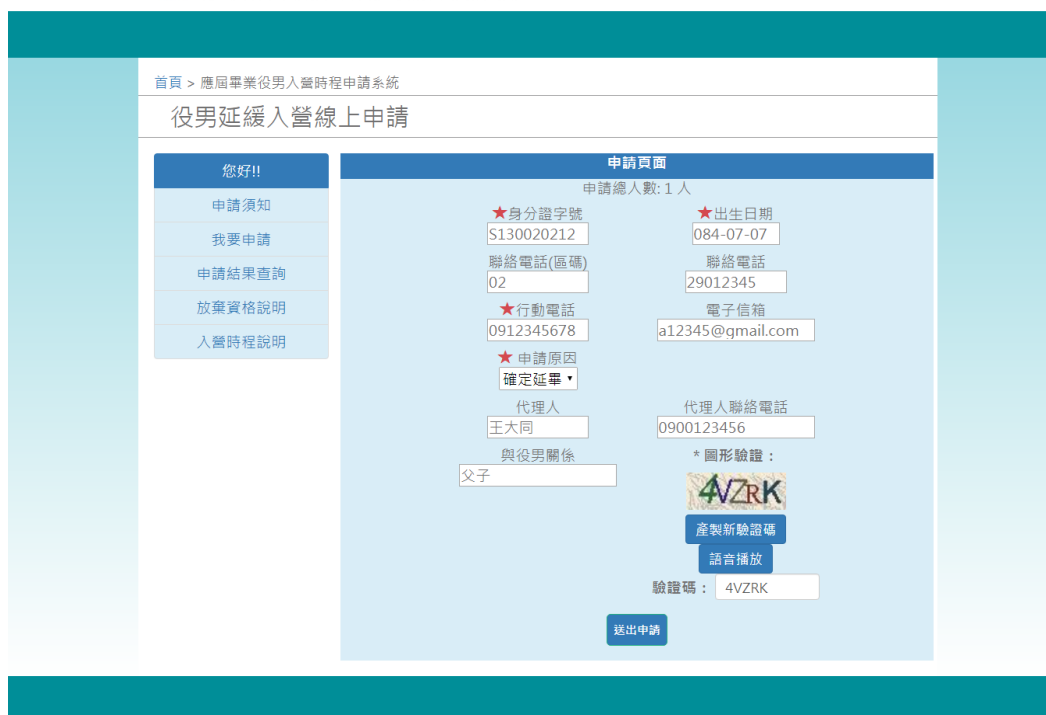
圖 4 役男延緩入營線上申請作業操作說明畫面(4)