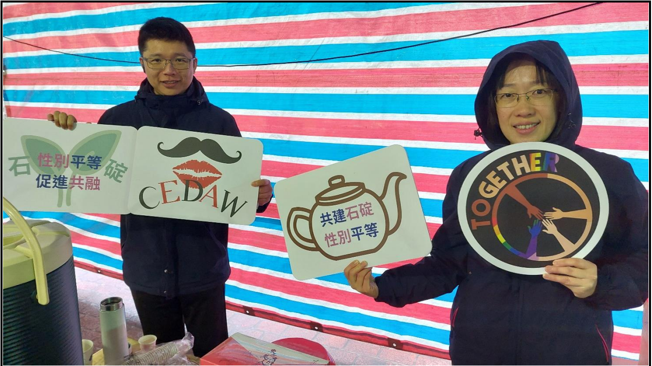
內容說明：114 年櫻花祭性平宣導活動