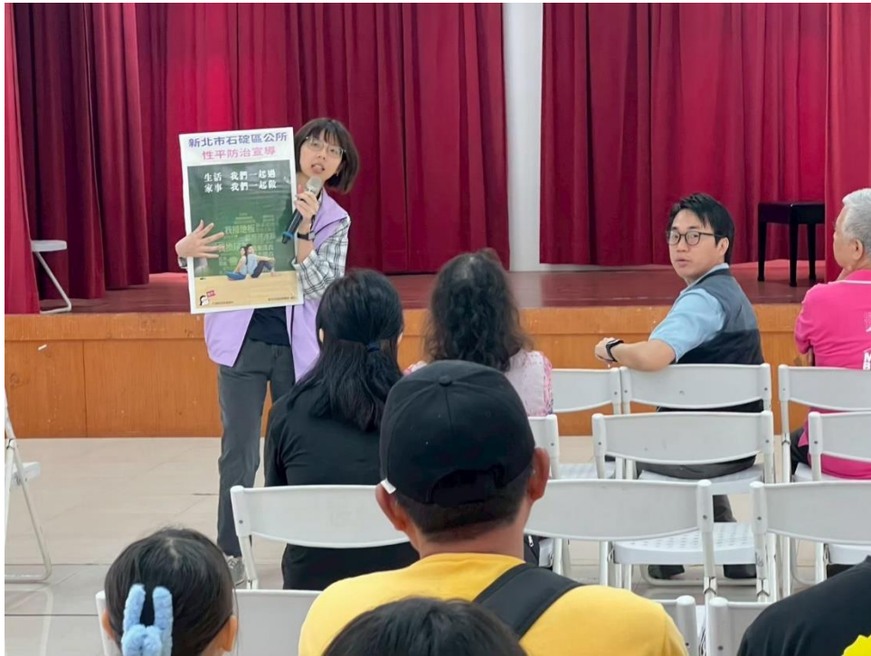
內容說明：114 年豐林社區節慶系列活動暨性別平等