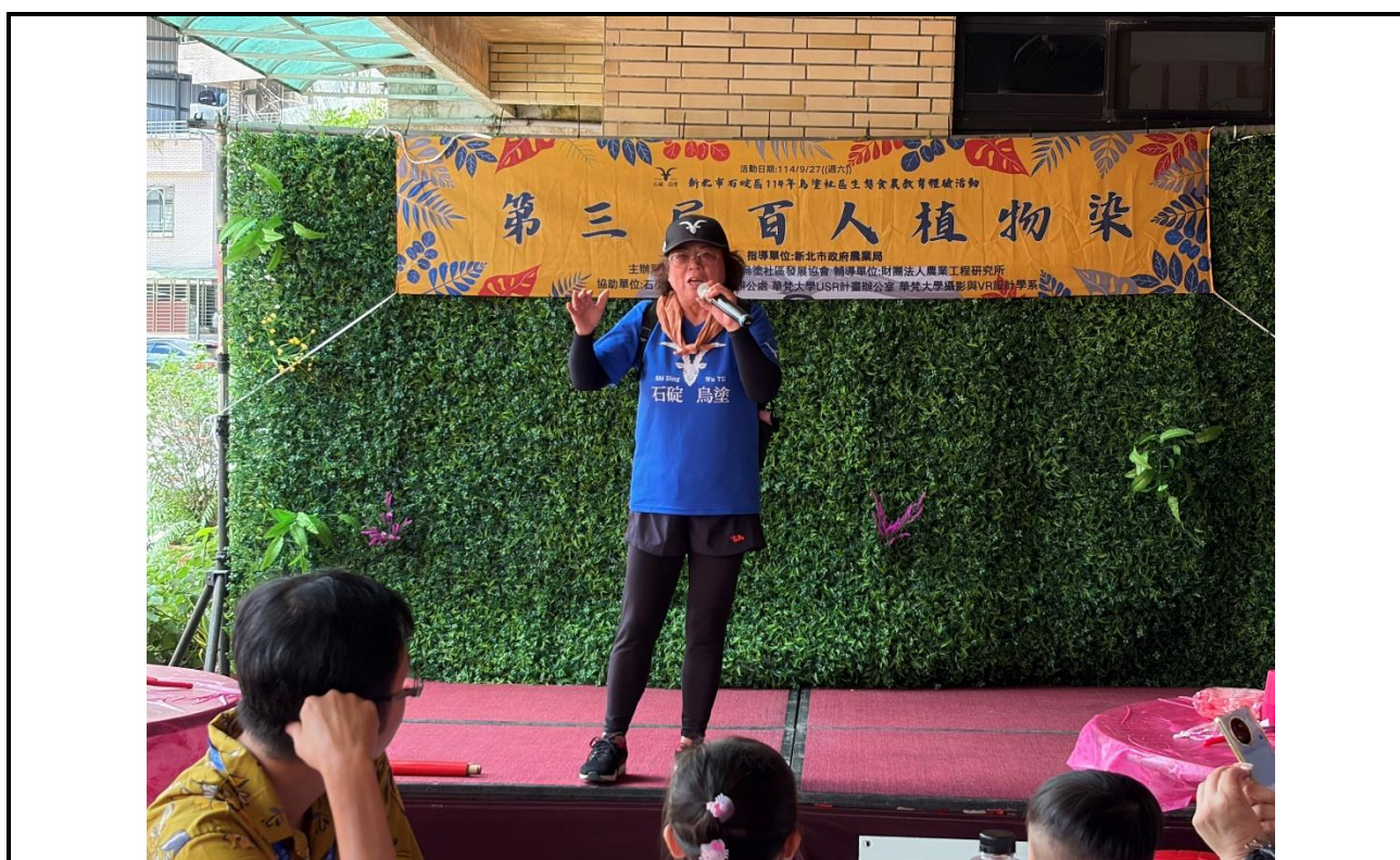
內容說明：百人植物染