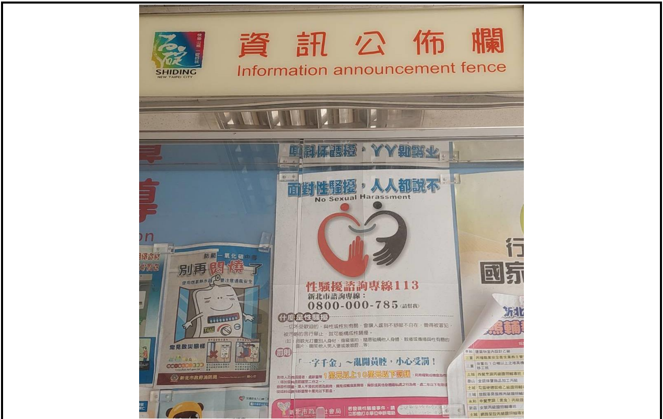
內容說明：性騷擾防治管道