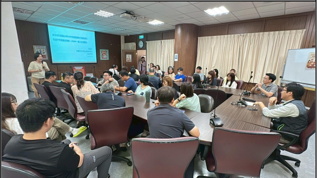
內容說明：114 年本所同仁性別平等教育訓練