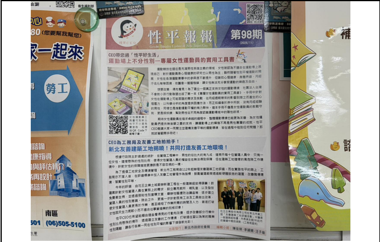
內容說明：性平報報