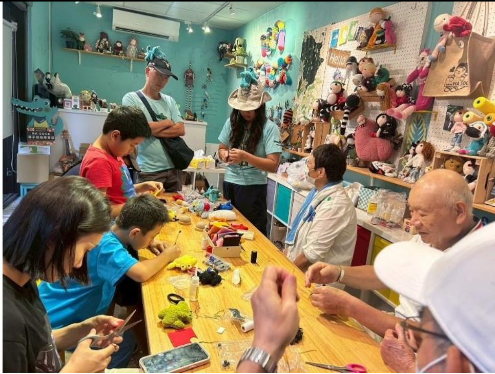
內容說明：祈福小旅行－縫紉教學