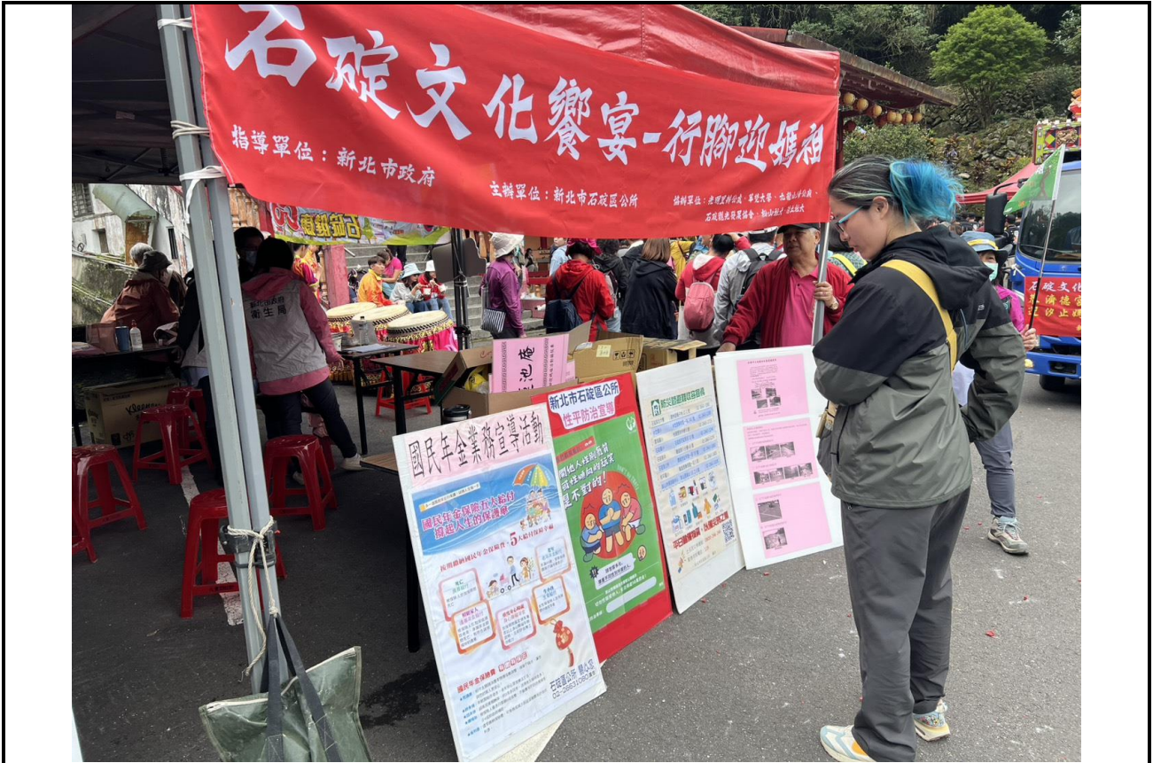
內容說明：114 年石碇文化饗宴暨性平宣導