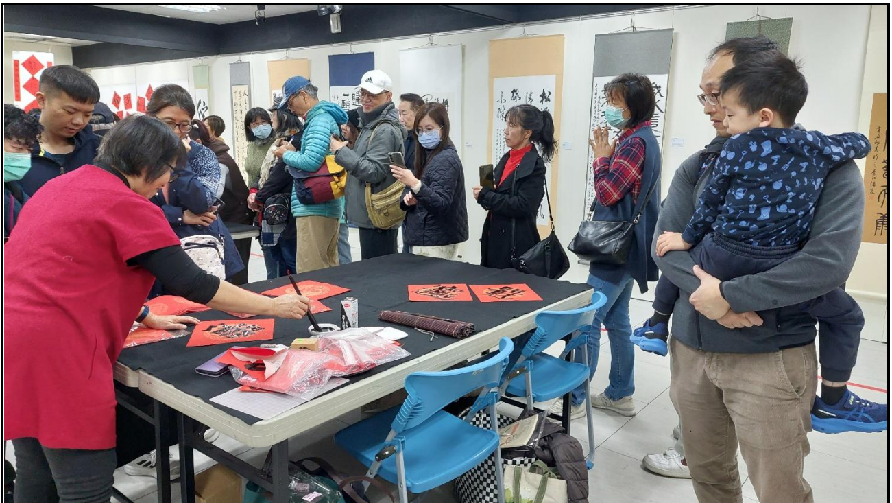
內容說明：石碇新春揮毫