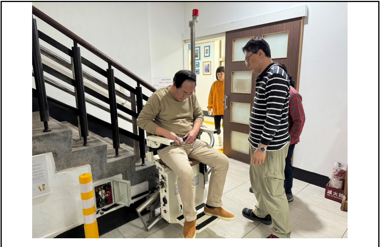
內容說明：淡蘭藝文館友善空間