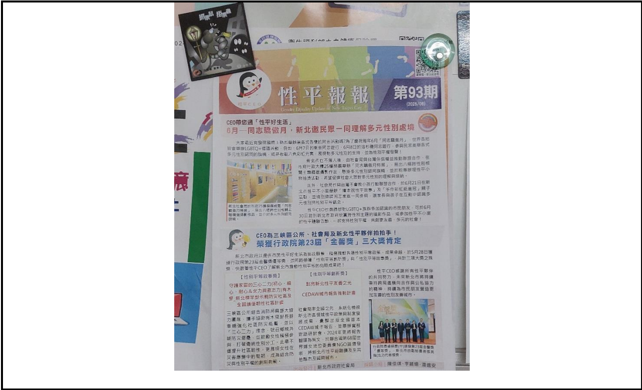
內容說明：性平報報