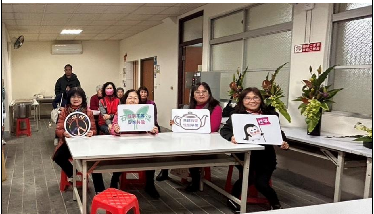
內容說明：114年插花班教室