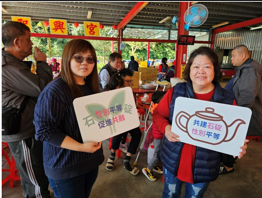
內容說明：114年初二回娘家