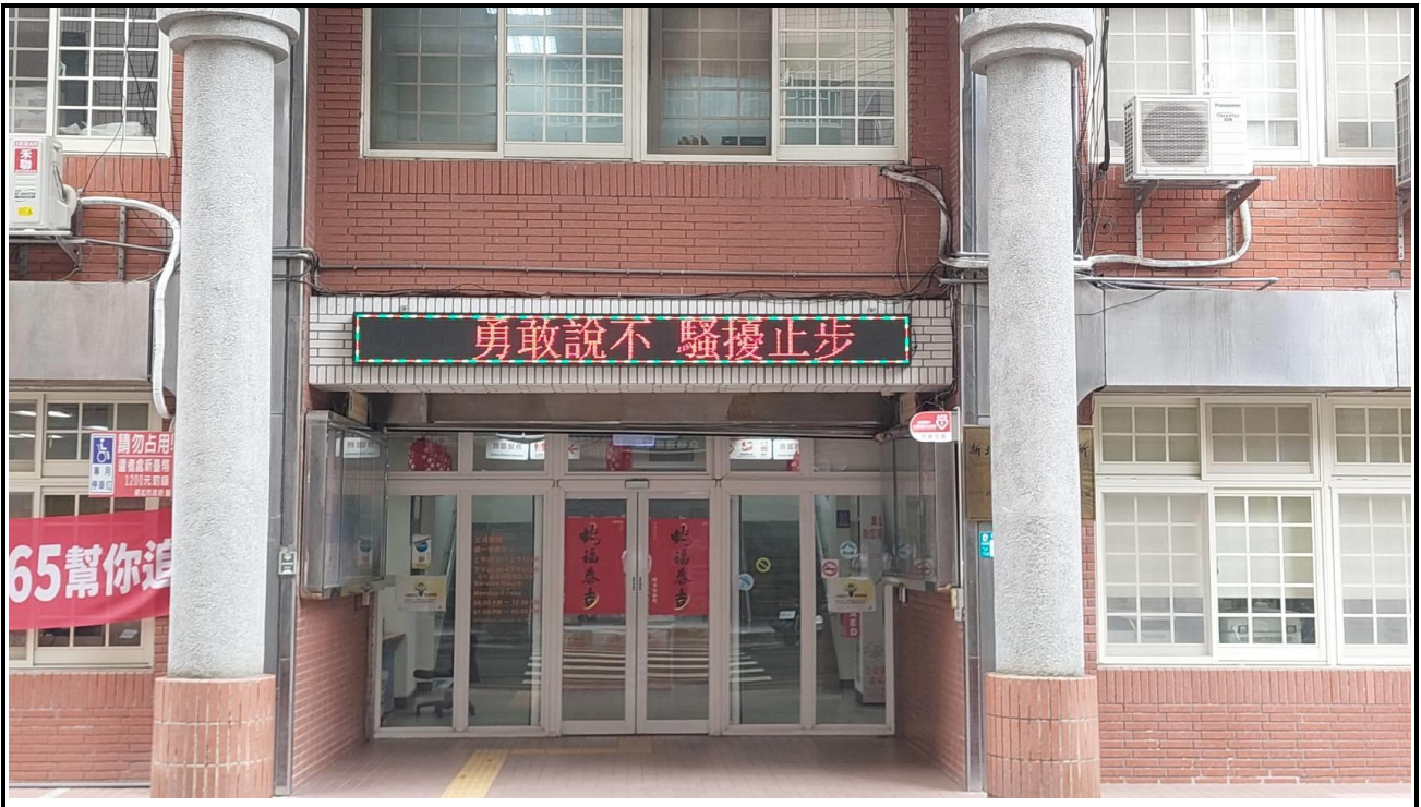
內容說明:性平標語宣導