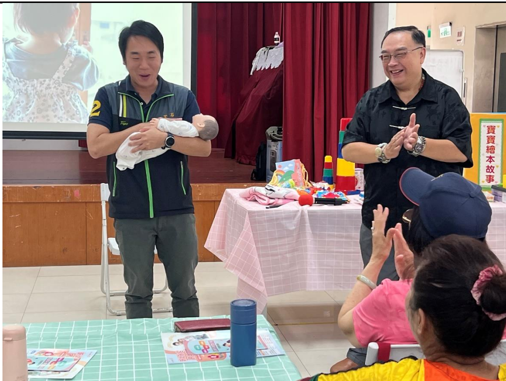
內容說明：114 年社區互助照顧好夥伴