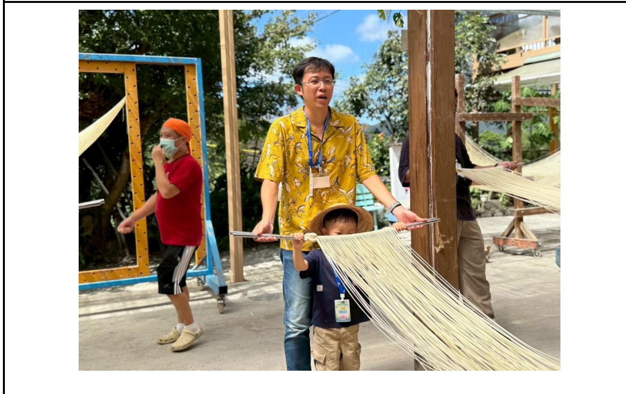
內容說明：小旅行-食農教育