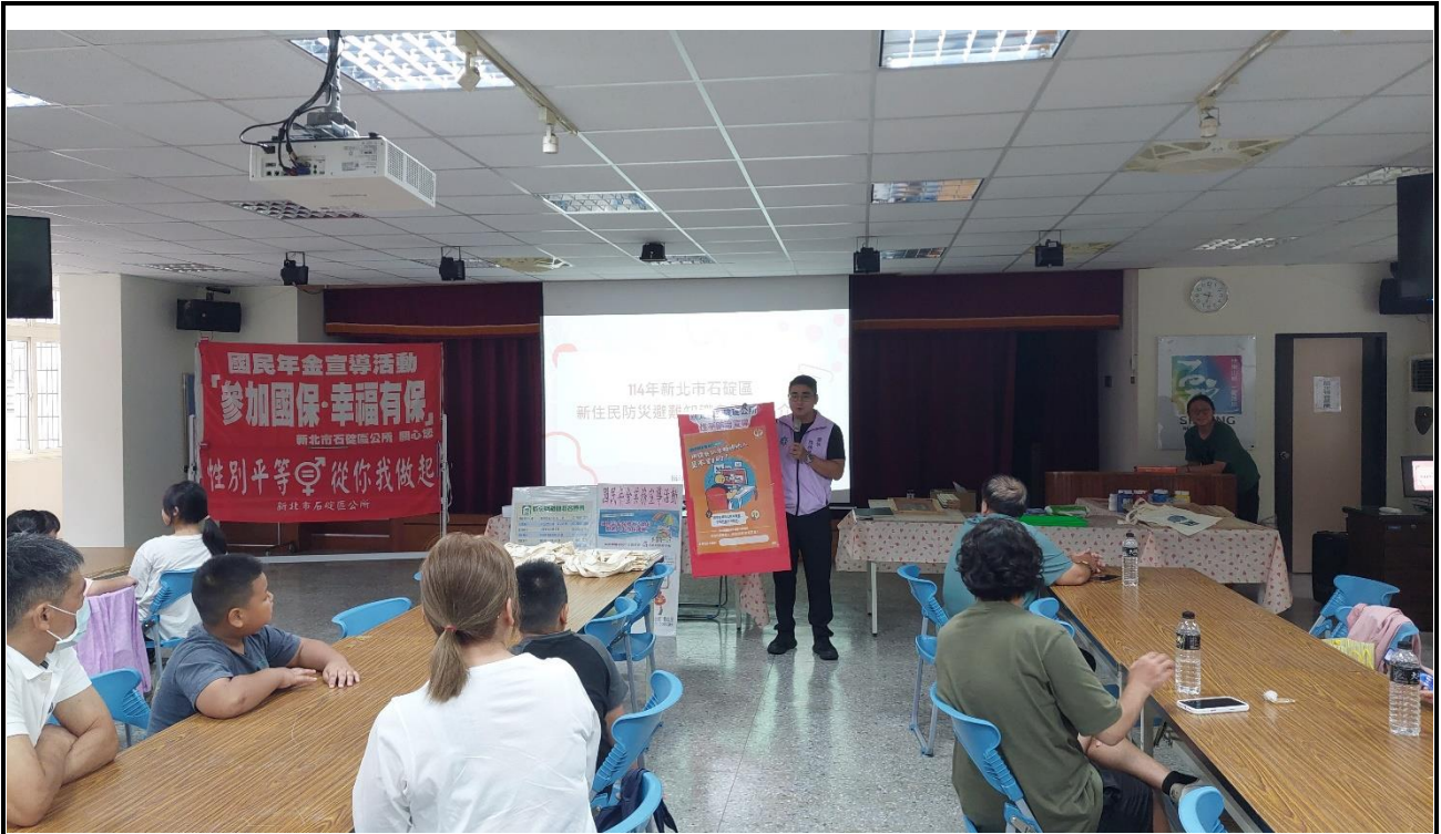
內容說明：114年新住民家庭聯誼暨親職教育課程活動