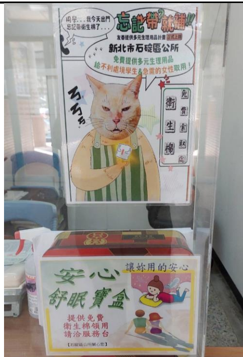
內容說明：月經平權宣導