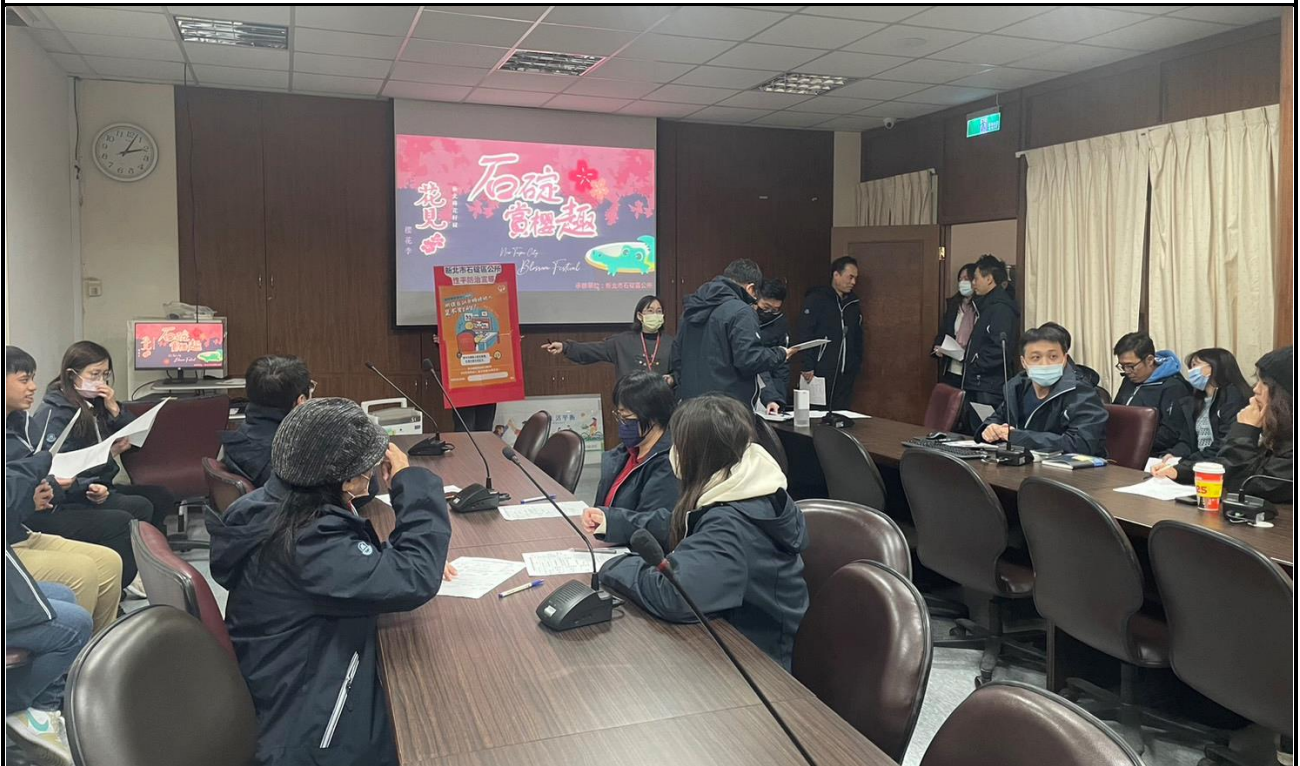
內容說明：114年工作會議性平宣導活動