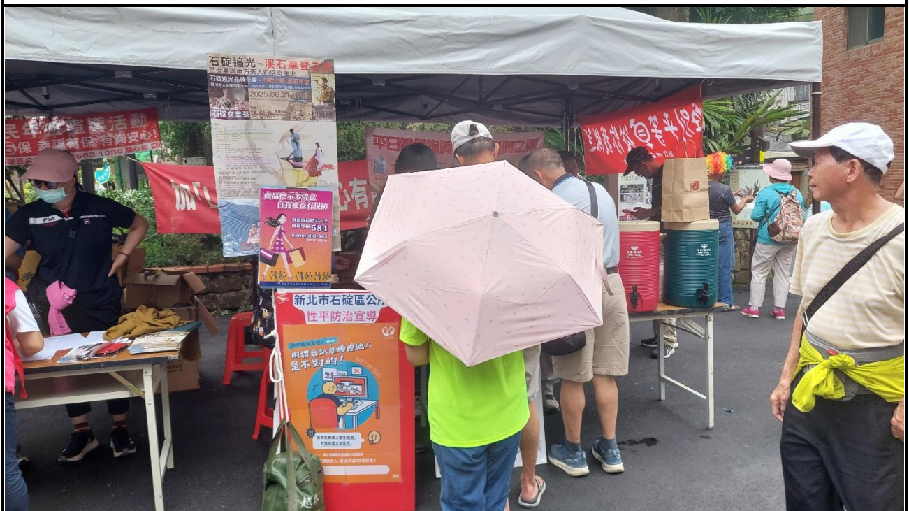
內容說明：114 年石碇追光茶會暨性平宣導