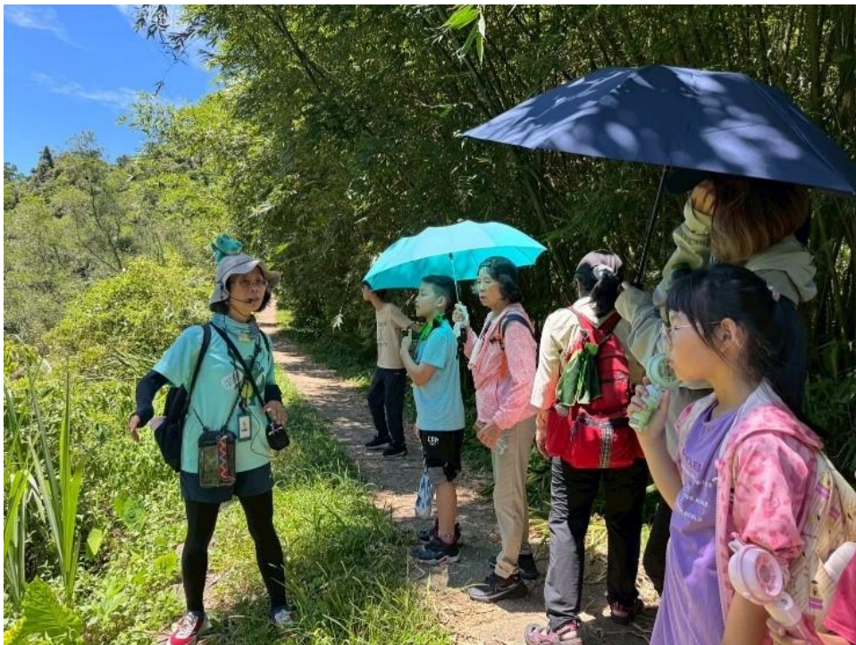
內容說明：祈福小旅行－導覽解說