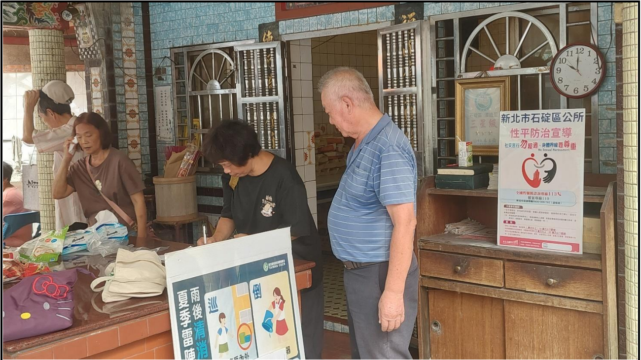
內容說明：114年潭邊社區節慶系列活動暨性平運動宣導